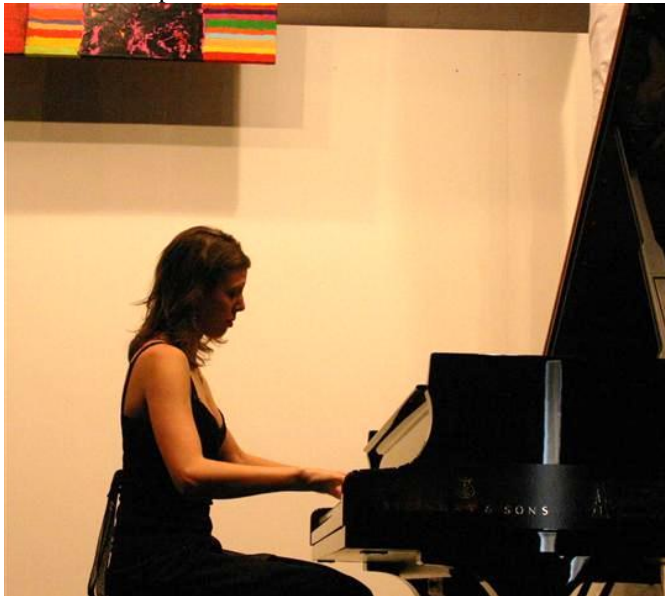
La pianiste franco-roumaine a charmé les anciens, jeudi.