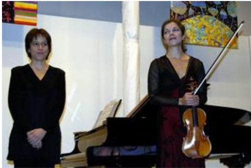
Un grand moment d'émotion avec la violoniste russe Liana Gourdjia et la pianiste Karine Selo.

Concert de prestige samedi soir, aux Musicales du Parc de Wesserling, avec pour invitée la violoniste russe Liana Gourdjia, en point d'orgue de cette seconde semaine d'un festival dédié aux talents d'aujourd'hui et de demain.