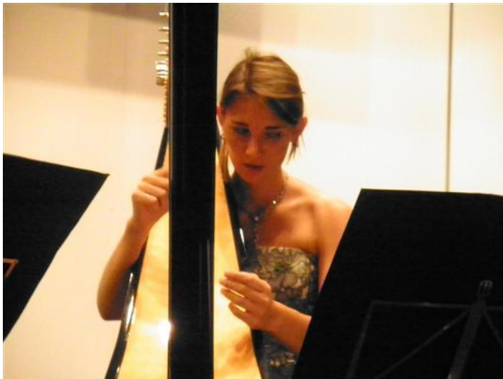
Les harpistes du Trinity collège de Londres : Trois fées aux doigts agiles.