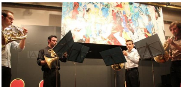
Le Laetonium Horn Quartet, sur la scène du Théâtre de poche du Parc de Wesserling.

Avec trois concerts la semaine dernière, au Théâtre de poche du Parc de Wesserling, les mélomanes ont une nouvelle fois été envoûtés.