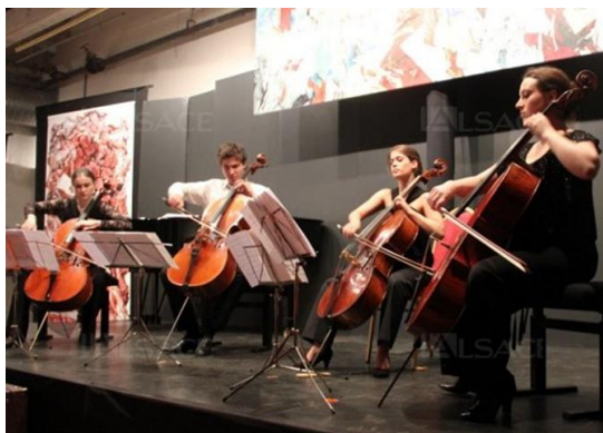
Un merveilleux quatuor de violoncelliste.

Le théâtre de poche du Parc de Wesserling a pour la 9ème fois connu l'émerveillement dispensé par des jeunes musiciens aux talents affirmés.